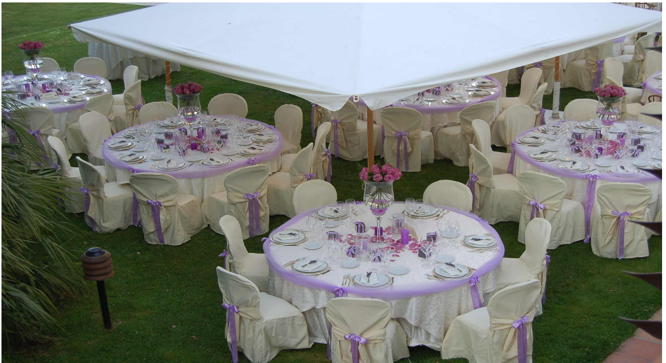
L'apparecchiatura in giardino